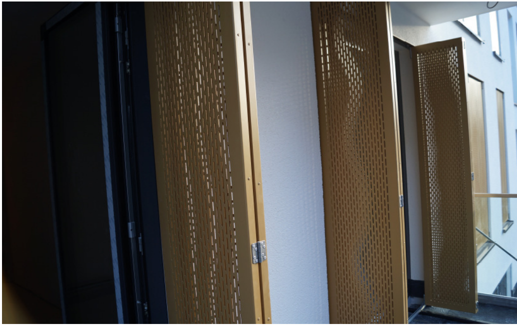
Bild 2: Außenansicht geöffnet